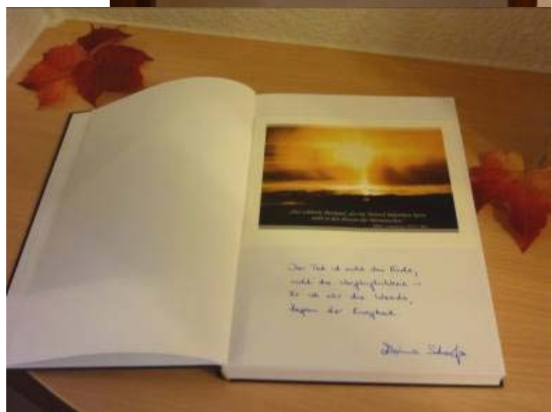
Gedenkecke im Foyer des Hauses und Kondolenzbuch für die persönliche Anteilnahme