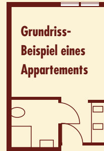
Grundriss-Beispiel eines Appartements