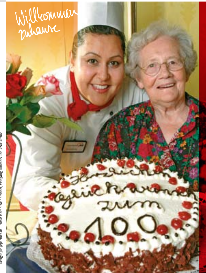
Design: Jungpartner.de

» Im Mittelpunkt unserer Arbeit steht der Mensch.« aus den AWO-Leitsätzen